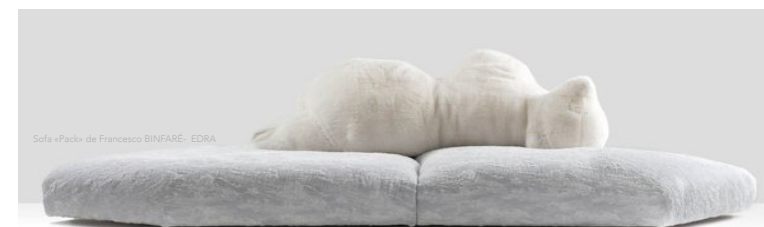
Sofa «Pack» de Francesco BINFARÉ- EDRA