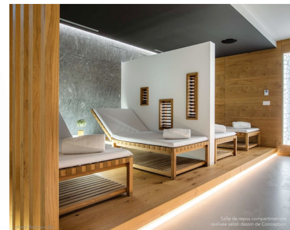
Salle de repos compartimentée réalisée selon dessin de Conception